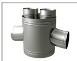
Cruz 90° sin goma Creu 90° sense goma