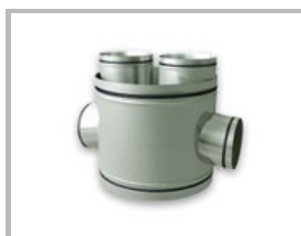
Cruz 90° con goma Creu 90° amb goma