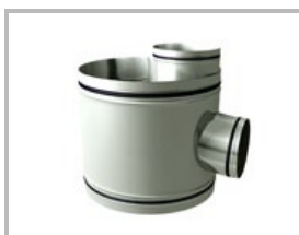
Te 90° con goma Te 90° amb goma