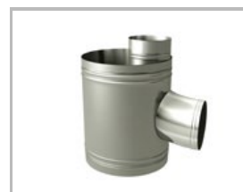
Te 90° sin goma Te 90° sense goma