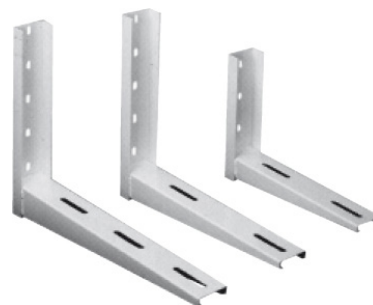
Escuadras para cajas